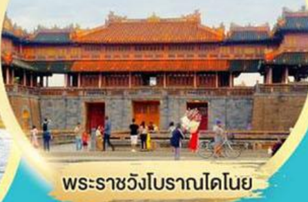
พระราชวังโบราณโคโนย