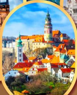
เชสท์ครุมลอฟ