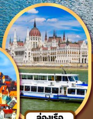
ล่องเรือ แม่น้ำดานูบ