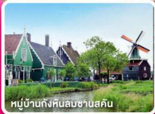
หมู่บ้านกังหันลมชาวนสคิน