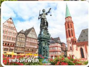
แฟรงค์เฟิร์ต