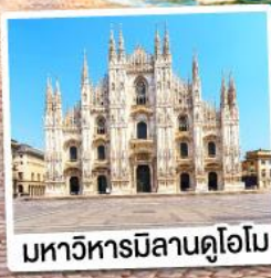
มหาวิหารมิลานดูโอโม

เมนูพิเศษ!! หอยเอสคาโก้ อาหารไทย, ฟองดูชีส