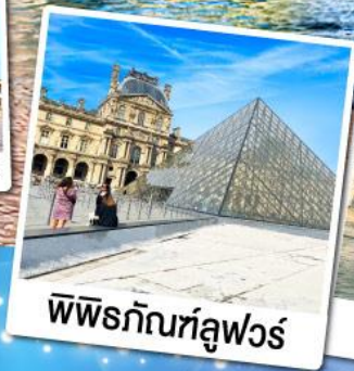
พีระกัมที่ลูฟวร์