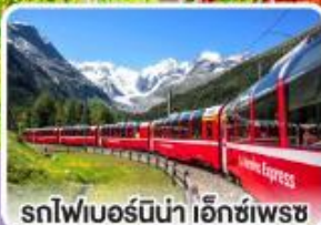
รถไฟเบอร์นินา เอ็กซ์เพรส