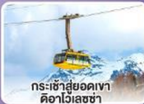
กระเช้าสู่ยอดเขา ดิวาไวเลซซา