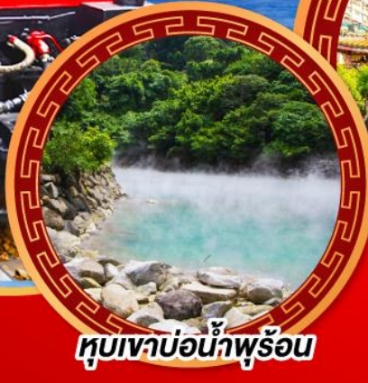
หุบเขาน้ำพุร้อน