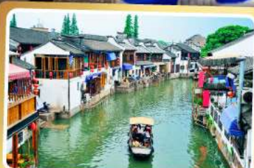
เมืองโบราณจูเจียเจียว