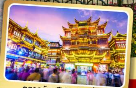
ตลาดร้อยปีฉงหวังเหมียว