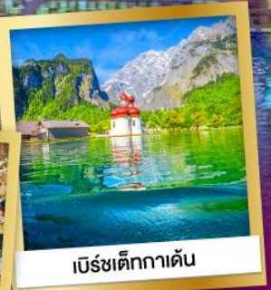
เบิร์ชเต็กกาเดิน