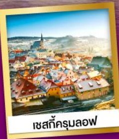
เชกส์ครุมลอฟ