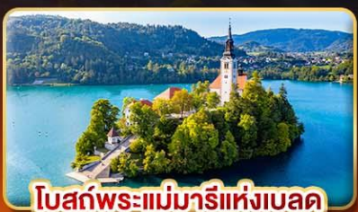
โบสถ์พระแม่มาเรียแห่งเบลด