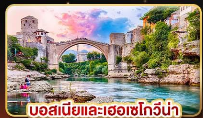
บอสเนียและเฮอร์เซโกวีนา