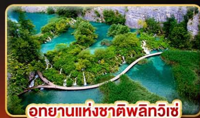
อุทยานแห่งชาติพลิทวิเช