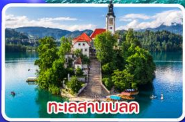
ทะเลสาบเบล็ด

ตามรอย Game of thrones ณ เมืองดুবรอฟนิก ไข่มุกแห่งออสเตรียตัก พร้อมขึ้นกระเช้า SRD