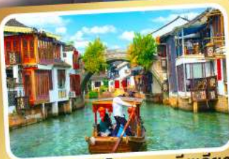
ล่องเรือเมืองโบราณซูโจวเจียเจียว