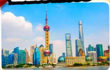
หอไข่มุก