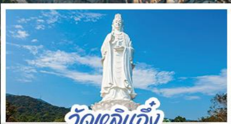
วัดเลิอัน