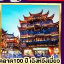
ตลาด 100 ปี เติ้งหวังเมี่ยว