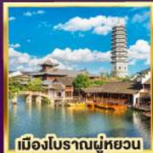
เมืองโบราณผู่หยวน

(อิสระ ช้อปปิ้ง หรือ สนุกสุดมันส์ที่ Disney Land)