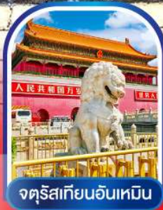
จัตุรัสเทียนอันเหมิน