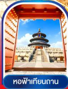
หอฟ้าเทียนถาน