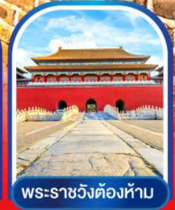
พระราชวังต้องห้าม