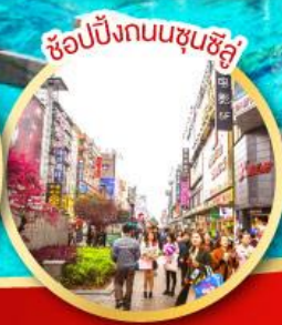
ช้อปปิ้งถนนชุนซีลู่