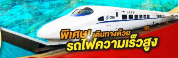
พิเศษ! เดินทางด้วย รถไฟความเร็วสูง