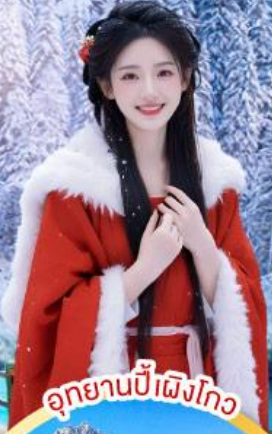
อุทยานปีเผิงโกว