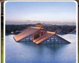
พิพิธภัณฑ์ไดน้ำกวงฟู่หลิน