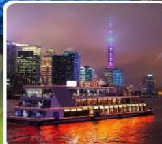
ล่องเรือแม่น้ำหวงผู่