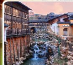
เมืองโบราณเหยาหู