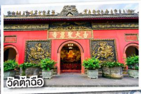
วัดต้าถื่อ