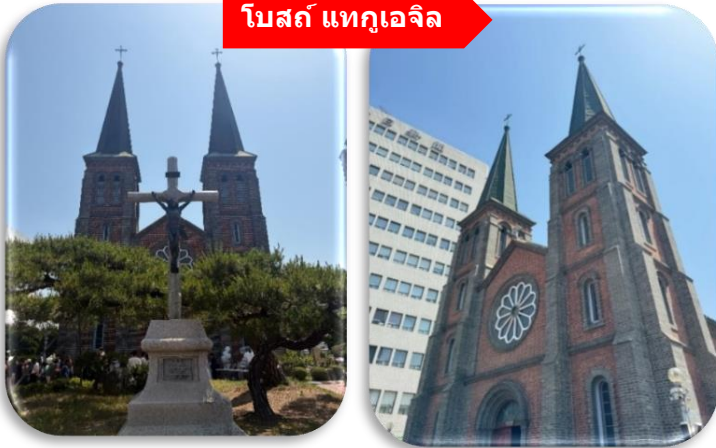
โบสถ์ แทกูเจ็ล

นำท่านเที่ยวชม โบสถ์แทกูเจ็ล โบสถ์นิกายโปรเตสแตนต์ที่เก่าแก่ที่สุดใน จังหวัดคย็องซังบุก (Gyeongsangbuk-do) ตั้งอยู่ในบริเวณ Cheongna ซึ่งเป็นย่านที่อยู่อาศัยของเหล่ามิชชันนารีที่มาอาศัยอยู่ใน เมืองแทกู