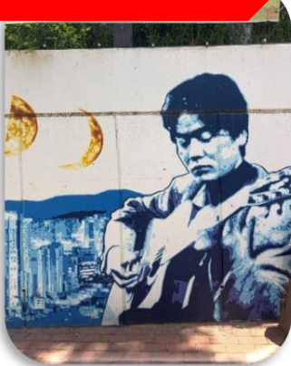
ถนนคิมควังซอก

นำท่านเที่ยวชม ถนนคิมควังซอก เป็นถนนสายเล็ก ๆ สดอบรื่นในเมืองแทกู ที่สร้างขึ้นเพื่อระลึกถึง คิมควังซอก นักร้องโฟล์กในตำนานของเกาหลีใต้ ผู้เกิดที่แทกูและเป็นศิลปินที่คนเกาหลียังคงรักมากจนถึงทุกวันนี้ เดิมทีบริเวณนี้เป็นกำแพงเก่าใต้ทางรถไฟ แต่ภายหลังถูกพัฒนาให้กลายเป็น "ถนนแห่งเสียงเพลงและความทรงจำ" ตลอดทางจะเต็มไปด้วยภาพวาดกราฟฟิตี้ รูปปั้นของคิมควังซอก งานศิลปะและมุมถ่ายรูปแนววินเทจ เส้นห์ของถนนนี้ไม่ใช่ความอลังการ แต่เป็นความรู้สึก "อบอุ่นและมีเรื่องราว" คาเฟ่ ร้านดนตรี และบรรยากาศย้อนยุค