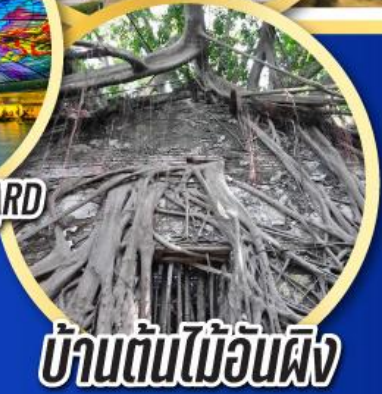
บ้านต้นไม้อันผิง