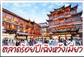
ตลาดร้อยปีเจิ้งหวงเหมียว