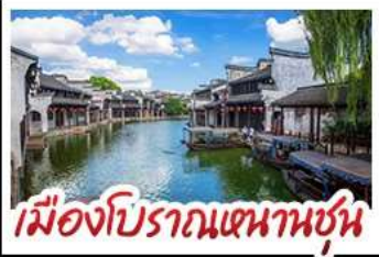
เมืองโบราณหนานชุน

DISNEYLAND SHANGHAI เต็มวัน เมืองโบราณหนานชุน (รวมล่องเรือ) - วัดจิ่งอัน เมืองโบราณหนานชุน - ตลาดร้อยปีเจิ้งหวงเหมียว มือพิเศษ บุฟเฟ่ต์ BBQ, เสี่ยวหลงเปา