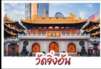
วัดจิ่งอัน