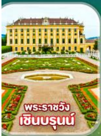
พระราชวัง เซินบรุนน์