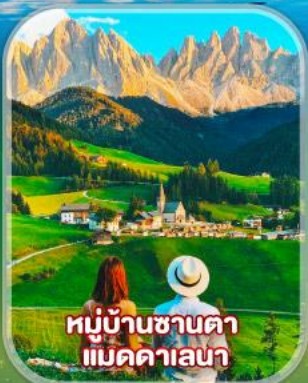
หมู่บ้านซานตา แม็คคาเลนา