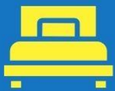
ห้องพักเดี่ยว SINGLE

ตัวอย่างประเภทห้องพัก *เป็นเพียงตัวอย่างเพื่อให้เห็นภาพสำหรับประเภทห้องในแบบต่างๆ