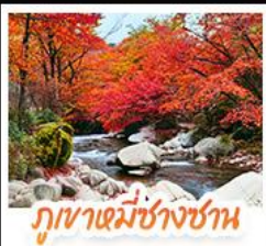
กุหาเซหมี่ชางชาน