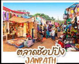
ตลาดช้อปปิ้ง JANPATH