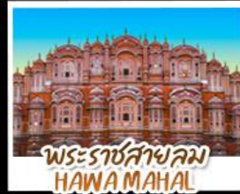
พระราชสาลม HAWA MAHAL