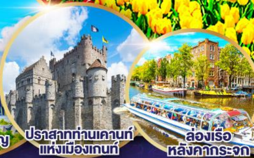
ปราสาทท่านเคานท์แห่งเมืองเกนท์