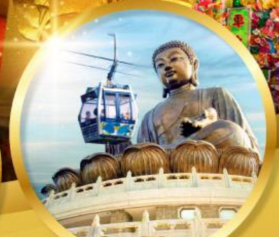
พระใหญ่โปะหลิน

นั่งรถรางพาร์คแกรมสู่ยอดเขาวิคตอเรียพาร์ค