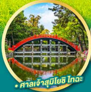
• ศาลเจ้าสุมิโยชิ ไทอะ