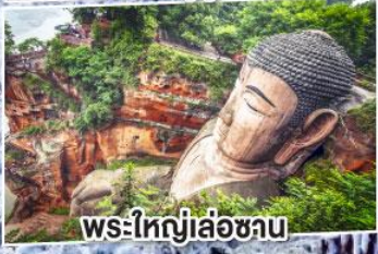
พระใหญ่เล่อซาน