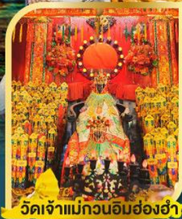
วัดเจ้าแม่กวนอิมฮ่องกง