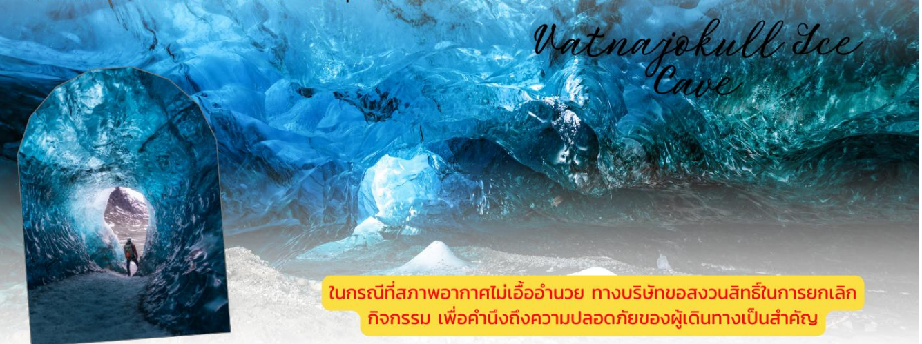
Vatnajokull Ice Cave

นำท่านเดินทางสู่ ถ้ำน้ำแข็งวักนาโจกุล (Vatnajokull Ice Cave) ระยะเวลาในการทำกิจกรรมประมาณ 4 ชั่วโมง เป็นหนึ่งในสถานที่ท่องเที่ยวที่น่าตื่นตาตื่นใจที่สุดในไอซ์แลนด์ ตั้งอยู่ภายในธารน้ำแข็งวักนาโจกุล ซึ่งเป็นธารน้ำแข็งที่ใหญ่ที่สุดในประเทศและมีขนาดใหญ่เป็นอันดับสองในยุโรป โดยมีพื้นที่มากกว่า 8,000 ตารางกิโลเมตร และถือเป็นพื้นที่ที่สำคัญในด้านภูมิศาสตร์และนิเวศวิทยา ถ้ำเหล่านี้ถูกสร้างขึ้นโดยการละลายและการเคลื่อนตัวของน้ำแข็งภายใต้ธารน้ำแข็ง ทำให้เกิดเป็นห้องโถงขนาดใหญ่ที่เต็มไปด้วยน้ำแข็งใสและสวยงาม มีสีฟ้าและขาวสะท้อนแสงในรูปแบบที่น่าทึ่ง นอกจากนี้ ภายในถ้ำยังมีรูปแบบที่หลากหลาย เช่น เสาหินน้ำแข็ง และร่องรอยจากการละลายที่สร้างลวดลายที่น่าสนใจ ซึ่งทำให้ทุกถ้ำมีลักษณะเฉพาะที่แตกต่างกันไป