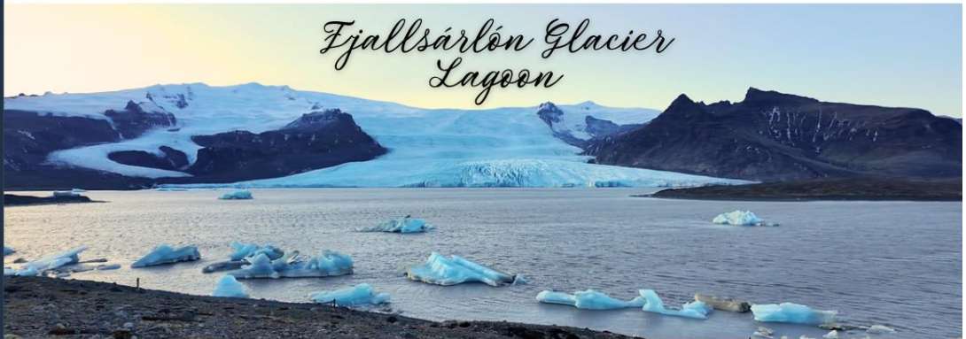
Fjallsárlón Glacier Lagoon

นำท่านเดินทางสู่ ธารน้ำแข็งพยาลล์ชาร์ลอน (Fjallsárlón Glacier Lagoon) เป็นทะเลสาบธารน้ำแข็งที่ตั้งอยู่ในเขตอุทยานแห่งชาติวักนาโจกุล (Vatnajökull National Park) ธารน้ำแข็งพยาลล์ชาร์ลอนเป็นสถานที่ที่เต็มไปด้วยความสวยงามของธรรมชาติ เจียบ สงบ และ เป็นทะเลสาบปิด ทำให้น้ำมีความนิ่งและก้อนน้ำแข็งในทะเลสาบมีลักษณะเฉพาะที่แตกต่าง