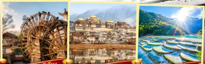
เมืองโบราณลี่เจียง วัดลามะชงจ้านหลิง หุบเขาพระจันทร์สีน้ำเงิน