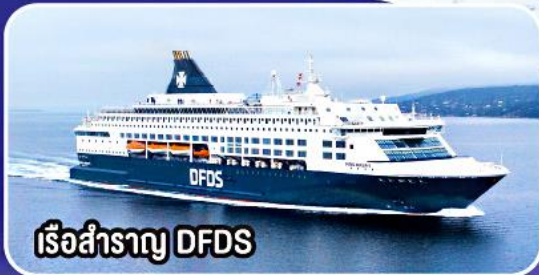
เรือสำราญ DFDS