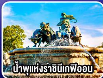
น้ำพุแห่งราชินีเกรฟวอน