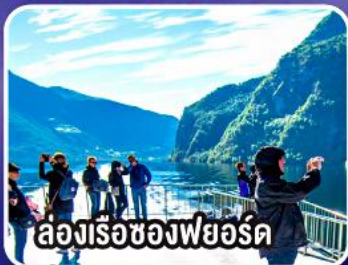
ล่องเรือช่องฟยอร์ด