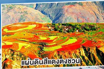
แผ่นดินสีแดงตงชวน