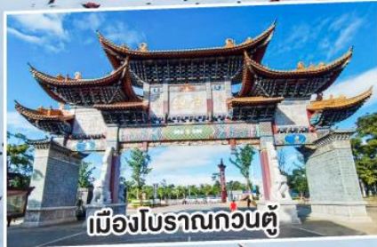
เมืองโบราณกวนตุ๋