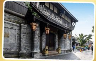
ถนนความใจ๋เซียงจ้อ