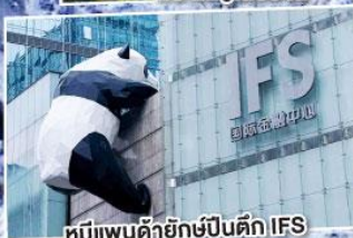
หมีแพนด้ายักษ์ปิงตึก IFS