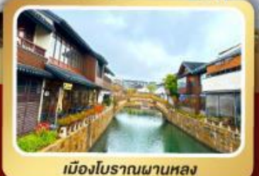
เมืองโบราณผานหลง