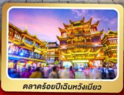
ตลาดร้อยปีเงินหวงเมี่ยว