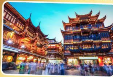
ตลาดร้อยปีเจิ้งหวังเหมียว