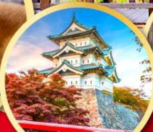
ปราสาทอโรร่า