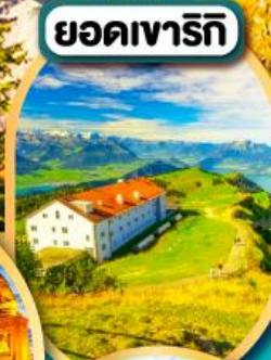
ยอดเขาริกิ