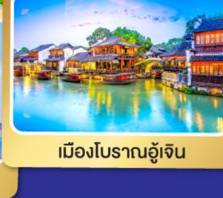
เมืองโบราณอู๋เจิน