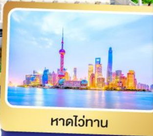
หาดไวกาน