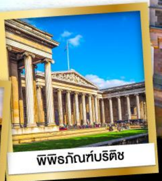
พิพิธภัณฑ์บริติช