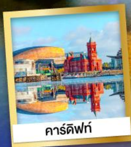
คาร์ดิฟฟ์