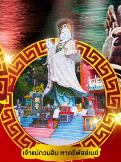
เจ้าแม่กวนอิม ทาคีพีส์เบย์