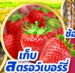
เก็บ สตอร์วเบอร์รี่