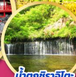
น้ำตกชิราอิโตะ