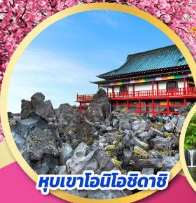
หุบเขาโอนิโอดาชิ