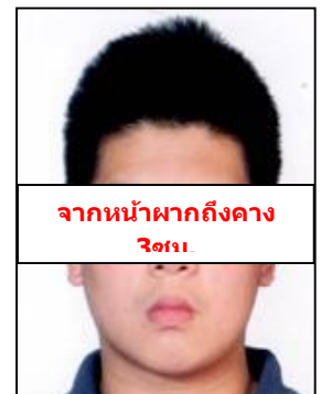
จากหน้าผากถึงคาง 3 ซม.