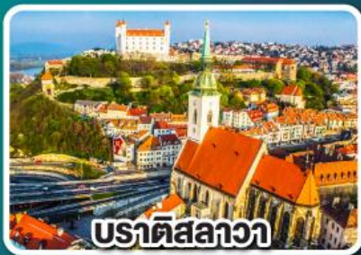
ปราทิสลาวา