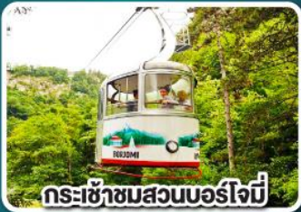
กระเช้าชมสวนบอร์โจมี