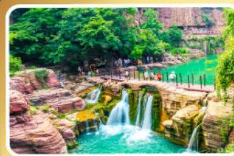
อุทยานหยุ่นโกซาน