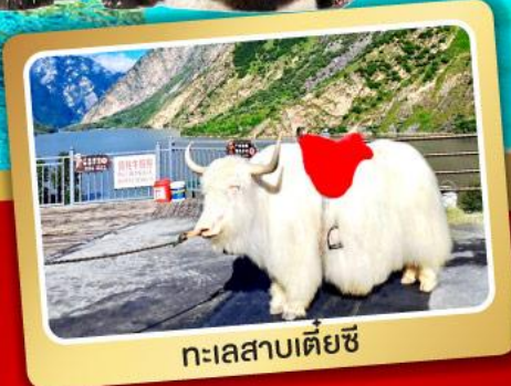
ทะเลสาบเตียซี