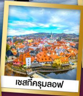
เซสกีครุมลอฟ