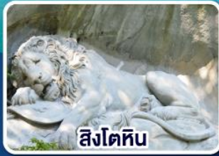
สิงโตหิน