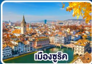
เมืองซูริค

19-25 ต.ค.66 16-22 พ.ย.66 22-28 พ.ย.66 24-30 พ.ย.66