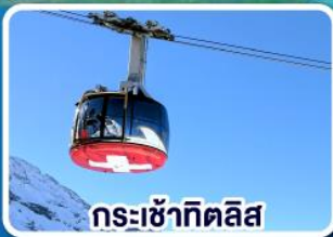
กระเช้าทิทลิส