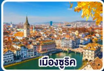
เมืองซูริค