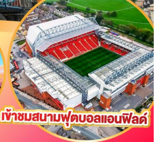
เข้าชมสนามฟุตบอลแอนฟิลด์

เมนูสุดพิเศษ!! Fish & Chips อาหารไทย และ ภัตตาคารดัง Four Season