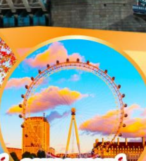
ลอนดอนอายส์