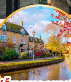
เบอร์ตันออนเดอะวอเตอร์