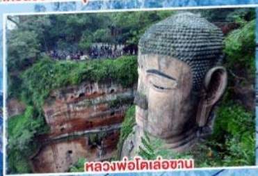
หลวงพ่อดเล่อซาน