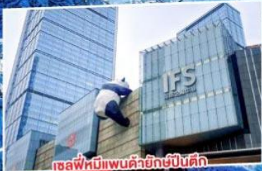
เซล์พีหิมะแพนด้ายักษ์ปิ่นคิง