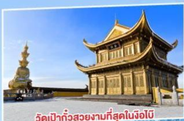
วัดเป่ากั๋วสวยงามที่สุดในจ้อไบ๊